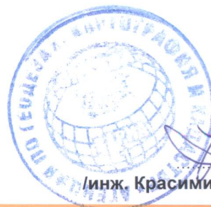
Схема № 13945 / 31.05.2012 г. е издадена въз основа на документ с входящ № 99-14651 / 29.05.2012 г.