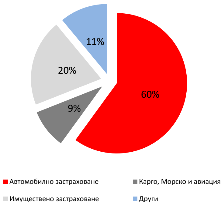
Премийен приход по линии бизнес за 2014 г.

Продуктите от групата на автомобилните застраховки са „Каско”, „Гражданска отговорност”. Автомобилните застраховки съставляват 60 % от премийния приход, реализиран през 2014 г. През 2014 г. застраховка „Каско” бележи ръст от 8% спрямо 2013 г. Като основен фактор за това развитие може да се посочи презпределението на застрахованите обекти между компаниите основни автомобилни застрахователи. Важно е да се отбележи, че въведените рестрикции в миналите години продължават да се прилагат и през 2014 година, или че този ръст е постигнат без да се либерализира издателската дейност. Застраховка „Гражданска отговорност” бележи спад спрямо 2013 г. с 10%. Този факт се дължи на обстоятелството, че за този вид застраховка е характерна силна конкурентна среда, както в нивата на комисионите, така и по отношение на тарифите. Компанията постоянно увеличава средните премии по тази застраховка и предлага диверсифицирана тарифа за различни географски области на страната, възрастова структура на водачите и други адекватни критерии.