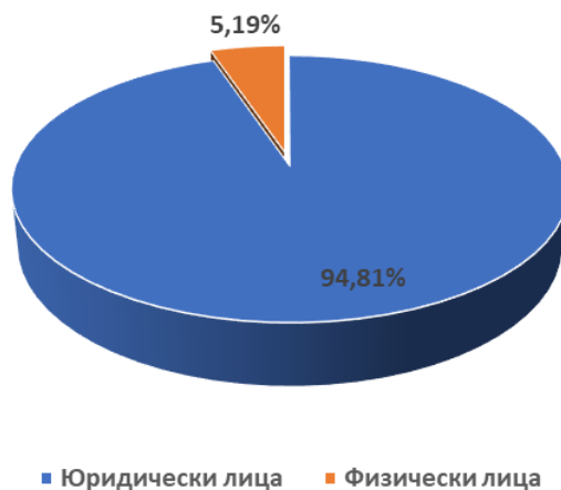
Акционерна структура на ФЕЕИ АДСИЦ към 31.12.2017г.