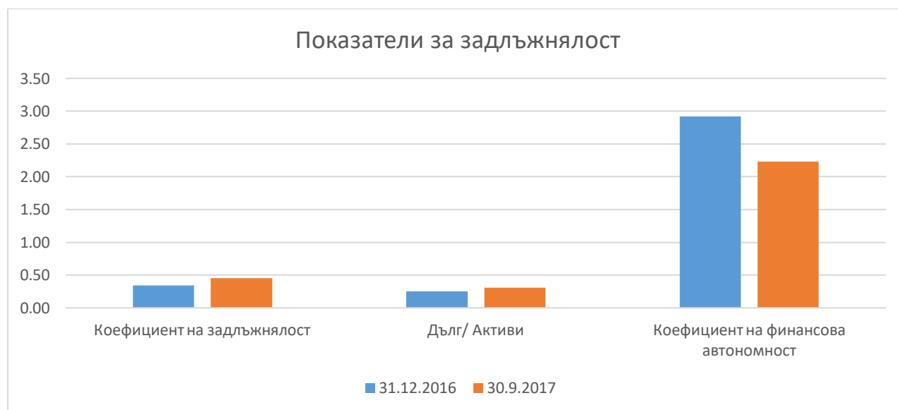
Таблица № 6