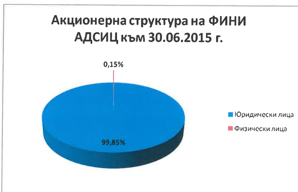
Структура на капитала на Емитента към 30.06.2015 г.