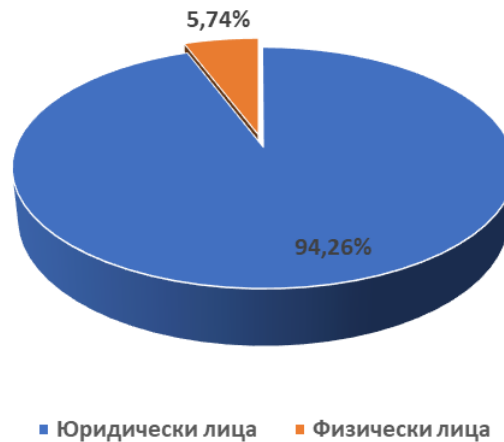
Акционерна структура на ФЕЕИ АДСИЦ към 31.12.2018г.