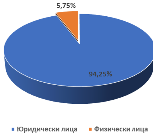
Акционерна структура на ФЕЕИ АДСИЦ към 30.09.2018г.