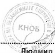
..... Людмил Симов

Настоящият Сертификат е издаден въз основа на Лиценз № 11097 от 29.01.2008 год. от Агенцията за приватизация