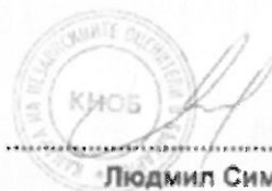
..... Людмил Симов

Настоящият Сертификат е издаден въз основа на Лиценз № 9706 от 01.08.2001 год. от Агенцията за приватизация