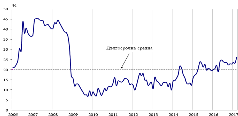
Фиг. 1. Бизнес климат - общо

По данни на Националния статистически институт през март 2017 г. общият показател на бизнес климата е 26,1 %, което е с 2.9 пункта повече в сравнение с февруари, което се дължи на подобрения бизнес климат в промишлеността, строителството и търговията на дребно.