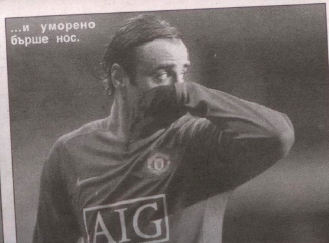
...и уморено бърше нос.