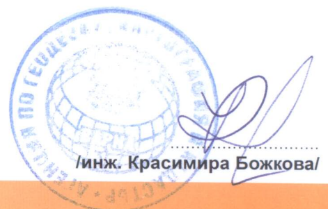
Схема № 13950 / 31.05.2012 г. е издадена въз основа на документ с входящ № 99-14651 / 29.05.2012 г.