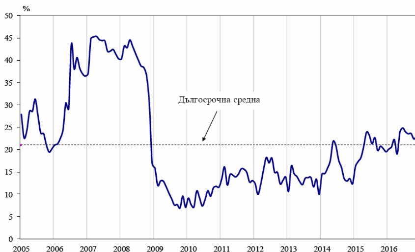
Фиг. 1. Бизнес климат - общо

Съставният показател „бизнес климат в промишлеността“ нараства с 2.3 пункта в сравнение с ноември, което се дължи на подобрените оценки и очаквания на промишлените предприемачи за бизнес състоянието на предприятията. Същевременно обаче осигуреността на производството с поръчки се оценява като леко намалена, което е съпроводено и с понижени очаквания за производствената активност през следващите три месеца.