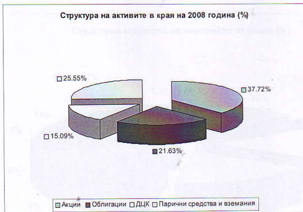
Фиг. 1 Структура на активите в края на 2008 година (%)