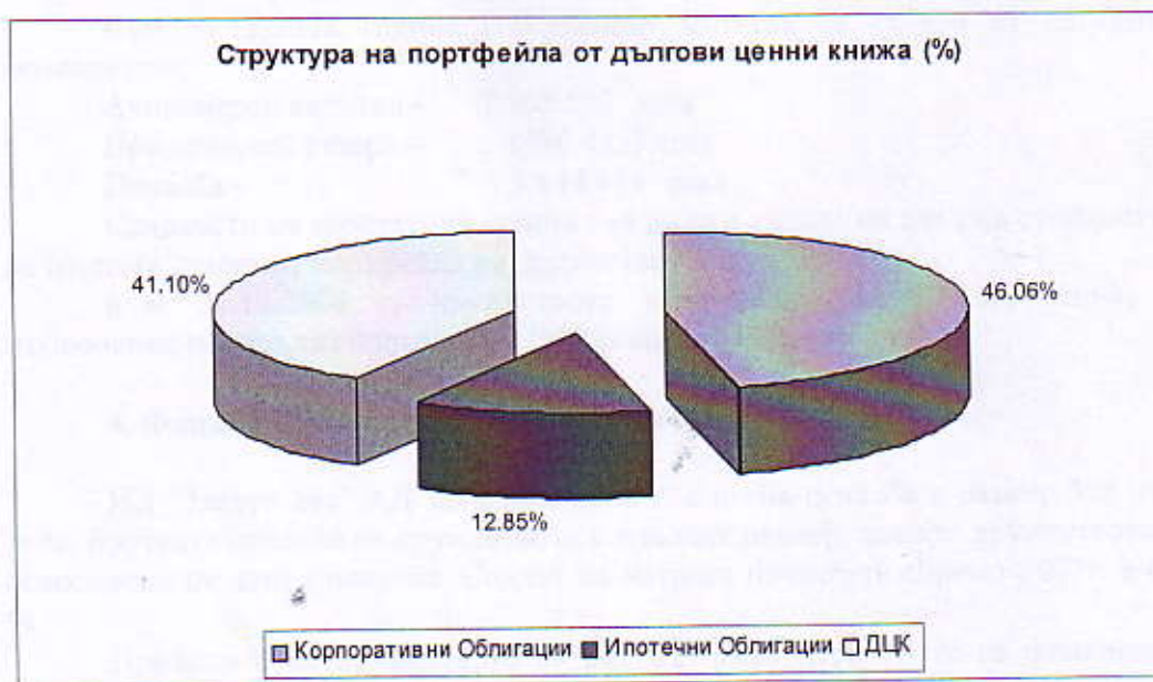
Фиг. 3. Структура на портфейла от дългови ценни книжа (%).

облигациите на „Търговска Лига“ АД и на „Ти Би Ай Кредит“ ЕАД 4. Не са закупувани нови емисии облигации, тъй като доходността им спрямо риска беше преценена като ниска.