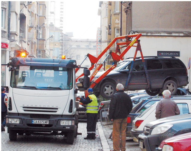
Паяци прибират автомобили нарушители с по-големи габарити и в най-тесните улици на столицата.

Само за 4 дни в столичния район „Красно село“ 229 души са намерили по колите си оставени от инспекторите констативни протоколи за неправилно паркиране с указване в тях на дните и часовете, в които да се явят, за да си платят глобите. „Паякът“ на Столичния инспекторат е отнесъл на наказа-