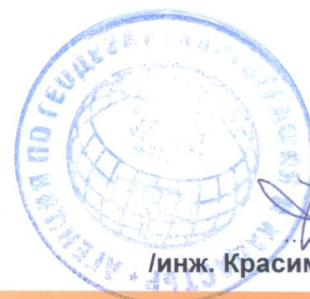
Схема № 13953 / 31.05.2012 г. е издадена въз основа на документ с входящ № 99-14651 / 29.05.2012 г.