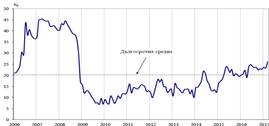
Фиг. 1. Бизнес климат - общо

По данни на Националния статистически институт през март 2017 г. общият показател на бизнес климата се повишава с 2.9 пункта в сравнение с февруари, което се дължи на подобрения бизнес климат в промишлеността, строителството и търговията на дребно.