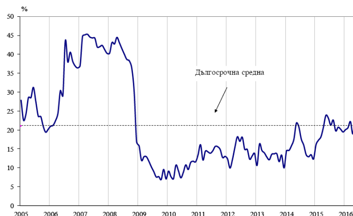
Фиг. 1. Бизнес климат - общо

В България, по данни на НСИ през юни 2016 г. общият показател на бизнес климата се покачва с 0.9 пункта спрямо май 2016 г. в резултат на подобрения бизнес климат в промишлеността, търговията на дребно и сектора на услугите.