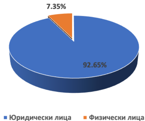
Акционерна структура на ФЕЕИ АДСИЦ към 30.09.2019г.