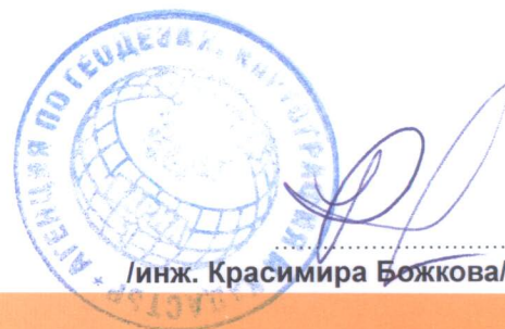
Схема № 13947 / 31.05.2012 г. е издадена въз основа на документ с входящ № 99-14651 / 29.05.2012 г.