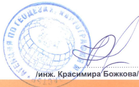
Схема № 13946 / 31.05.2012 г. е издадена въз основа на документ с входящ № 99-14651 / 29.05.2012 г.