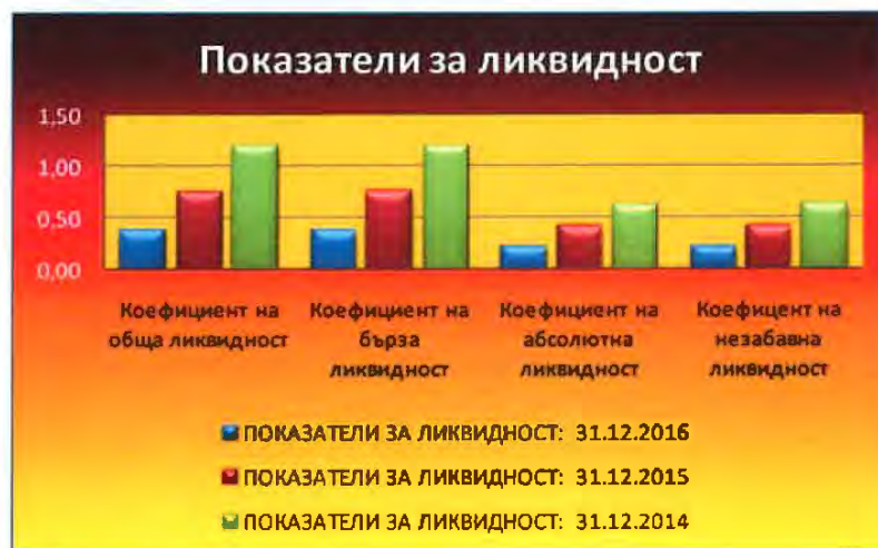
Таблица № 5