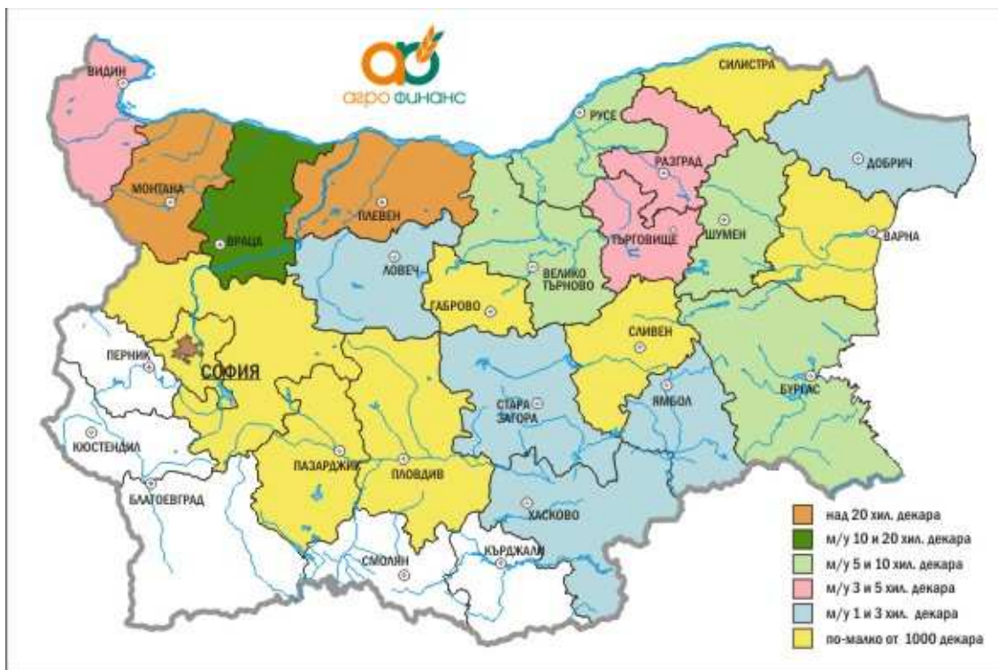
Карта на земеделската земя в портфейла на дружеството по области на страната към 30.11.2009г.

Борсова информация за „АГРО ФИНАНС“ АД СИЦ за м. ноември 2009 г.