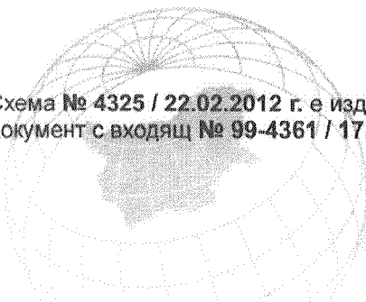
Схема № 4325 / 22.02.2012 г. е издадена въз основа на документ с входящ № 99-4361 / 17.02.2012 г.