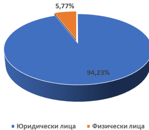
Акционерна структура на ФЕЕИ АДСИЦ към 31.03.2018г.