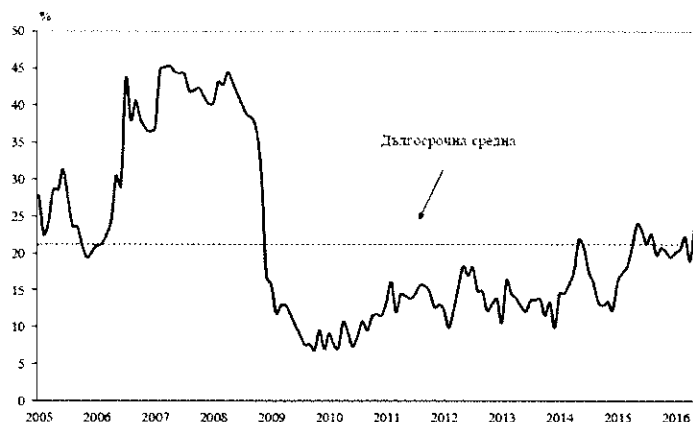
Фиг. 1. Бизнес климат - общо

Съставният показател „бизнес климат в промишлеността“ нараства с 0.8 пункта в сравнение с предходния месец, което се дължи на оптимистичните оценки на промишлените предприемачи за настоящото бизнес състояние на предприятията. Несигурната икономическа среда остава основният проблем за развитието на бизнеса, посочен от 49.7 % от предприятията.