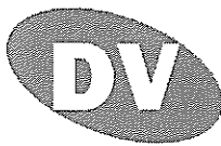
Разпределение на активите на Дн Вп Хармония към 30/06/2018