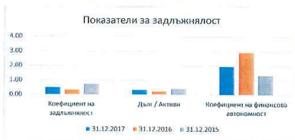
Таблица № 7