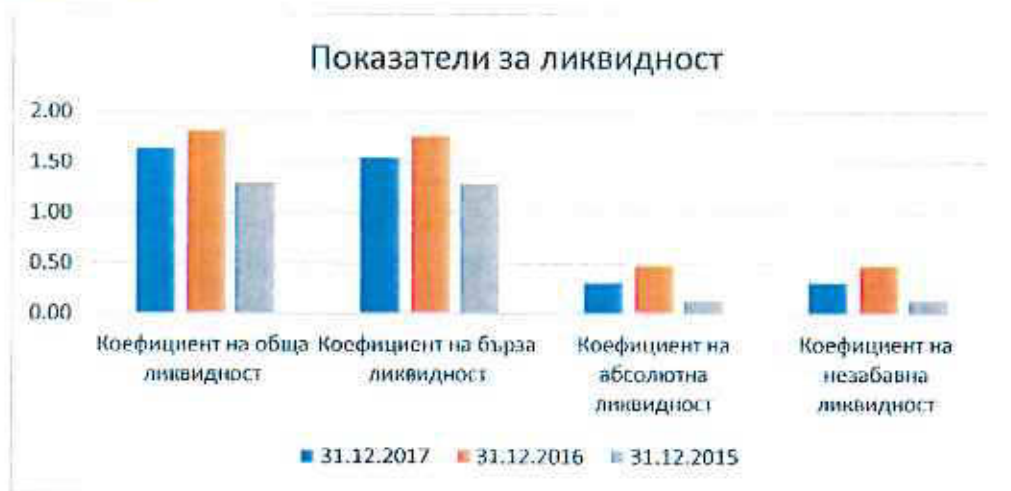
Таблица № 6