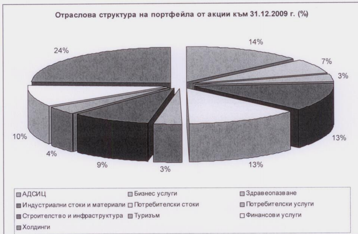
Фиг. 1 Отраслова структура на портфейла от акции към 31.12.2009 г. (%)