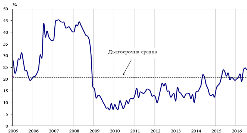
Фиг. 1. Бизнес климат - общо

Анкетата отчита подобрение на показателя в промишлеността, строителството и търговията на дребно, докато в сектора на услугите се регистрира понижение.