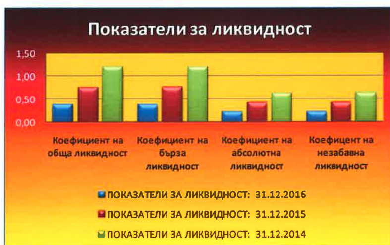
Таблица № 5