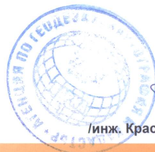
Схема № 13948 / 31.05.2012 г. е издадена въз основа на документ с входящ № 99-14651 / 29.05.2012 г.