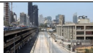
Ливан: Страна на ръба на бездната 5 5