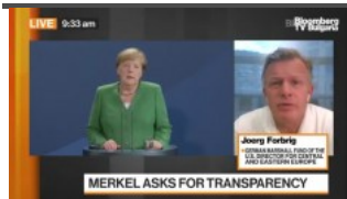
Какво ще си кажат Меркел и Столтенберг за сигурността в Европа? 1 1