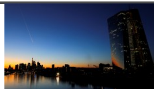
ЕЦБ е готова да адаптира инструментите си според нуждите 1 1