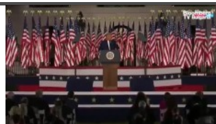
Доналд Тръмп: Байдън е Троянският кон на социализма в САЩ 1 1