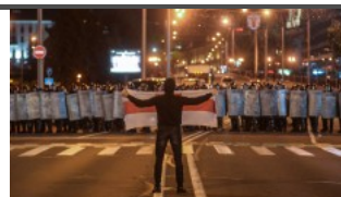
Спечели ли шести мандат Лукашенко? 3 6