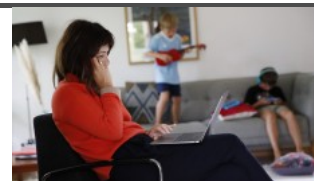
Водещи компании преосмислят управленските си практики в новата реалност