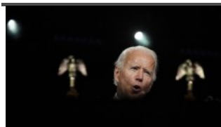
Байдън: Тръмп не защити Америка. Това е непростиимо