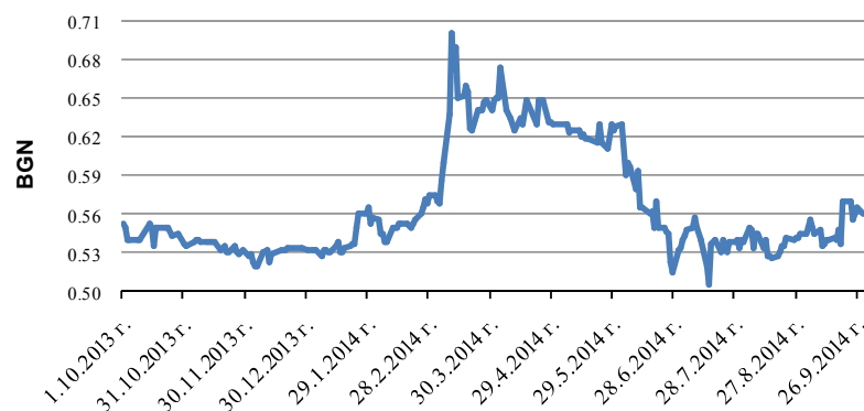
Движение акциите на ФНИБ (01.10.2013г. - 30.09.2014г.)