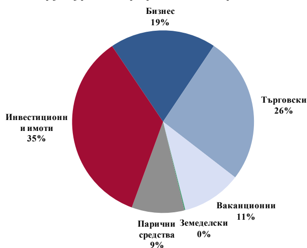
Структура на портфейла III-то трим. 2014г.