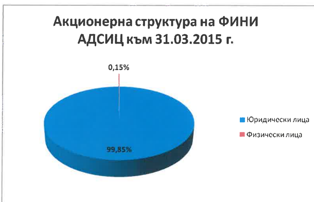
Структура на капитала на Емитента към 31.03.2015 г.