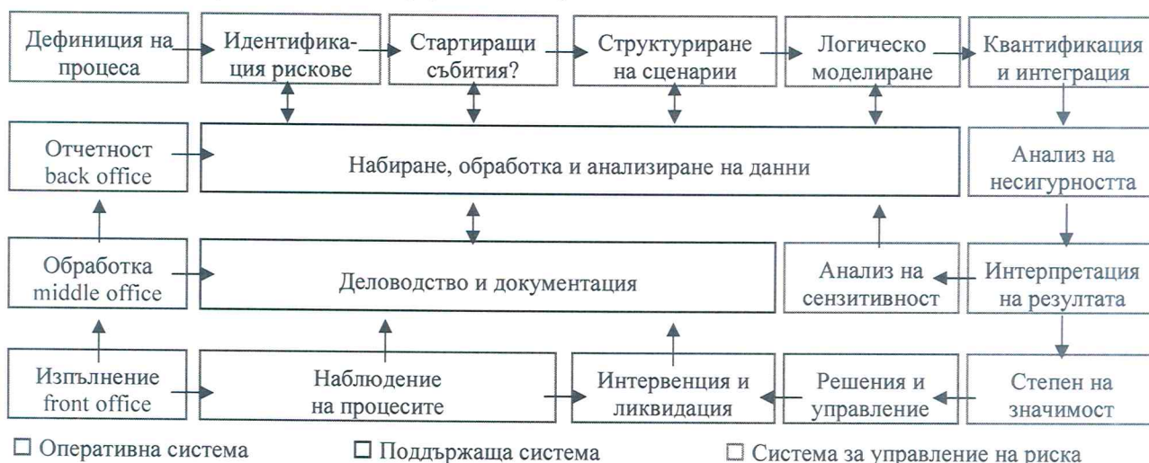
Таблица 6: Структура на системата за управление на риска SAPRAM

За разлика от повечето използвани във финансовата индустрия методи системата SAPRAM, както и генеричната PRA методика представлява интегриран модел , който работи с пълното рисково пространство , а не с отделни негови компоненти. Ще поясним.