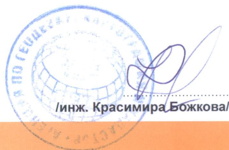
Схема № 13949 / 31.05.2012 г. е издадена въз основа на документ с входящ № 99-14651 / 29.05.2012 г.