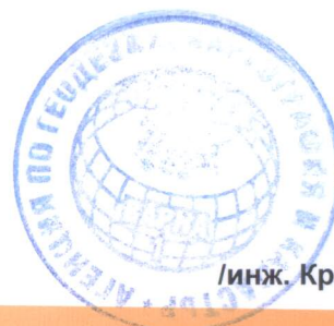
Схема № 13951 / 31.05.2012 г. е издадена въз основа на документ с входящ № 99-14651 / 29.05.2012 г.