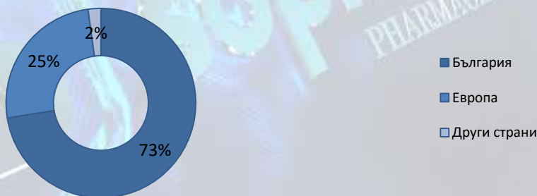
Разпределение по географски региони на приходите от продажби

Приносът на продажбите в България към консолидираните приходи от продажби през първо полугодие на 2016 г. възлиза на 73%, като същите се увеличават с 2% спрямо същия период на 2015 г. Софарма заема 4 % от общия обем на българския фармацевтичен пазар в стойност и 13% от продажбите в натурално изражение. Позициите на основните конкуренти на дружеството на територията на страната са както следва: Novartis—8% (4% в бр.), Roche – 6 (0,3% в бр.), Sanofi-Aventis – 5% (3% в бр.), Actavis - 5% (11% в бр.), Glaxosmithkline – 4% (2% в бр.), Astra Zeneca – 3 % (1% в бр.), Bayer – 3% (2% в бр.).