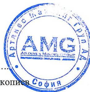
Прокопи Прокопиев София