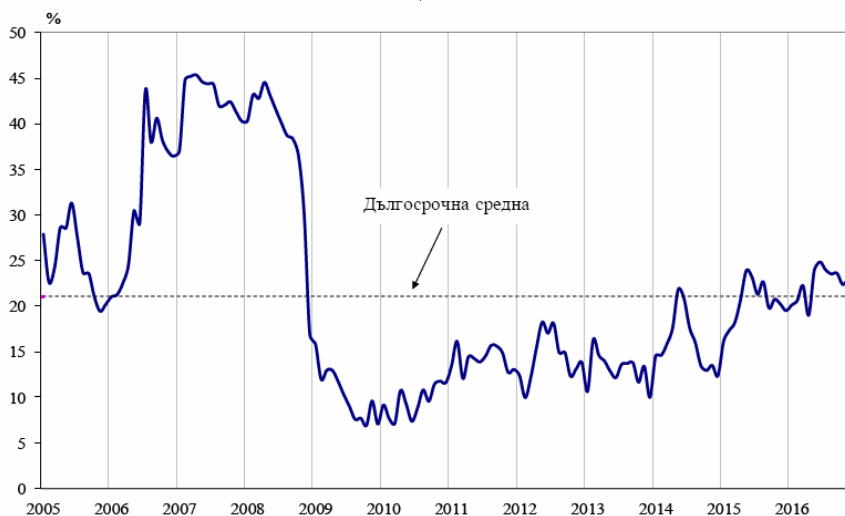
Фиг. 1. Бизнес климат - общо

Съставният показател „бизнес климат в промишлеността“ нараства с 2.3 пункта в сравнение с ноември, което се дължи на подобрените оценки и очаквания на промишлените предприемачи за бизнес състоянието на предприятията. Същевременно обаче осигуреността на производството с поръчки се оценява като леко намалена, което е съпроводено и с понижени очаквания за производствената активност през следващите три месеца.